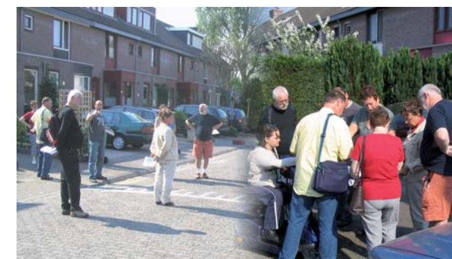
(De jaarlijkse wijkshow)