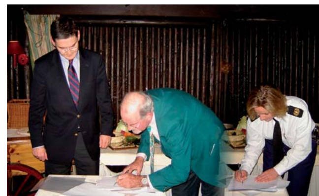
(Wijkplatform, gemeente en Politie tekenen het wijkveiligheidsconvenant)

Start Wijkveiligheidsplan - 13 december 2005